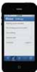
Совместим с системами iOS и Android