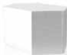
Пластинчатый противоточный рекуператор собственного производства