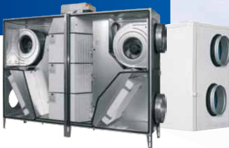
DUPLEX Flexi и DUPLEX EC4

Компания ATREA является одной из ведущих компаний в области вентиляции и рекуперации тепла. ATREA – это высокое качество, постоянные инновации, высокая производительность и надежное партнерство. Благодаря всем этим преимуществам продукция компании ATREA подобна произведениям искусства. В результате накопленных технических знаний и давних традиций продукция нашей компании хорошо известна во всей Европе.